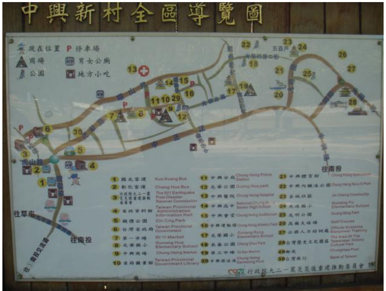
(圖三)中興新村全區導覽圖

代，並擁有減免水電費的優待、全省最便宜的員工餐廳和到中興會堂看電影的優待卷，是當時令人稱羨的居住地點。