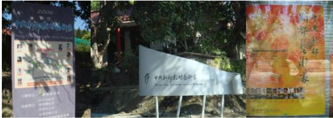
(圖四)中興新村內駐村藝術家的看板、地標及海報

藝術成果發表之專屬展場，甄選藝術家進駐，期讓藝術家、社區及政府共創風貌保存、設施運用、藝術獎助、地方繁榮的三贏之局。(註八)