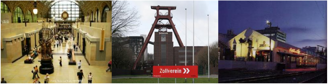
(圖六)由左至右為奧賽美術館、魯爾工業區第 12 號礦區、第 20 號倉庫