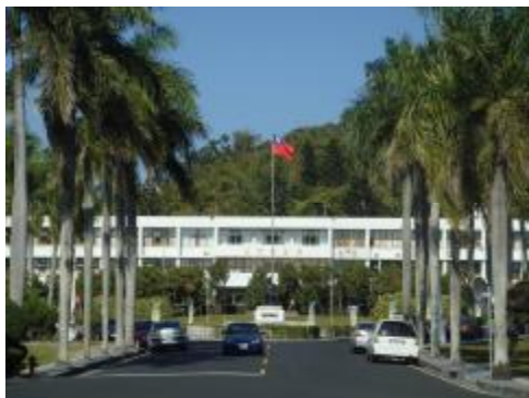
(圖一)台灣省政府辦公大樓

民國四十四年為因應兩岸對戰，中央決議將台灣省政府疏遷至中部以集中行政效能，當時選定現今霧峰鄉的光復新村為第一疏散區，為一暫時性辦公地，中興新村則為第二疏散區，是省政府預定地，進而參